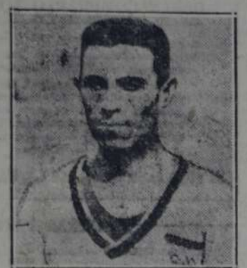
SERAFIN DENGRA Campeón sudamericano de los 800 metros

El atletismo durante el año 1917 no ha sido todo lo pródigo que podía esperarse en atención a las características que esa rama deportiva había adquirido en los años anteriores. El equipo local ha experimentado la desagradable sorpresa de una derrota internacional en el Campeonato sudamericano realizado en Santiago, no obstante