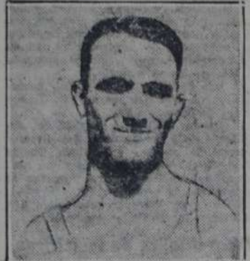
JUAN PINA Campeón sudamericano de los 100 y 200 metros y "recordman" en esta última distancia, en 21" 4/5. En los 100, varias veces ha registrado 10" 4/5.

En lanzamientos las variantes sólo se pusieron de manifiesto en disco, donde este año, en los últimos meses, cuatro hombres superaron los 40 metros, distancia antes apreciada como excepcional: Domínguez, Romana, Elsa y Edwin. El primero y Elsa son indudablemente los mejores por la regularidad de sus tiros. En los lanzamientos restantes poco se ha hecho, a excepción de la jabalina, donde se ha descolado con hombres nuevos: Newbery, en Chile, ganó pasando los 53